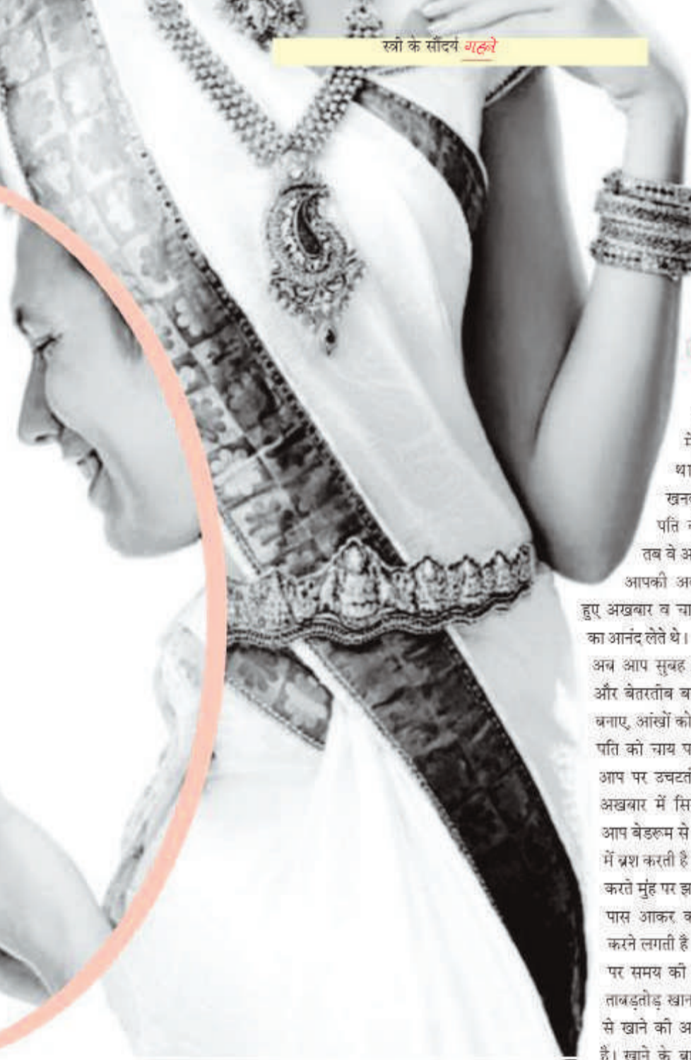
स्त्री के सौंदर्य गहने

हवाए रखें बैडरूम की गहिरा उम्र बढ़ने के साथ अधिकांश महिलाएं शयन कक्ष को संवेदनशीलता का अर्थ खोने लगती हैं। उन्हें लगता है कि अब क्या शयनकक्ष और क्या उसकी प्राइवैसी? लेकिन वे भूल जाती हैं कि हमारे शास्त्रों में भी स्त्री के पांच प्रमुख गुणों में एक गुण 'शयनेषु रम्या' पर बहुत जोर दिया है। शयन कक्ष ही वह मनोरम कक्ष है जहां रंपती अपने प्रारंभिक दिनों को बार-बार जीने के लिए प्रयास करते हैं। कुछ स्त्रियां समय के साथ साथ बाहरी कपड़ों और एक्सेसरीज पर तो ध्यान देती हैं लेकिन अपने इनरवेयर और नाइट्री वगैरह में कटीती करने लगती हैं। लेकिन अब इन नुस्खों को भी अपना कर देखिए। आज भी आप वैसे ही इनरवेयर पहन कर देखिए जैसे आप पहले पहनती थीं। तितली के पंखों से नानुक और खूबसूरत अंतःस्त्रव निश्रय ही आपके पति के मूड को बदल देंगे।