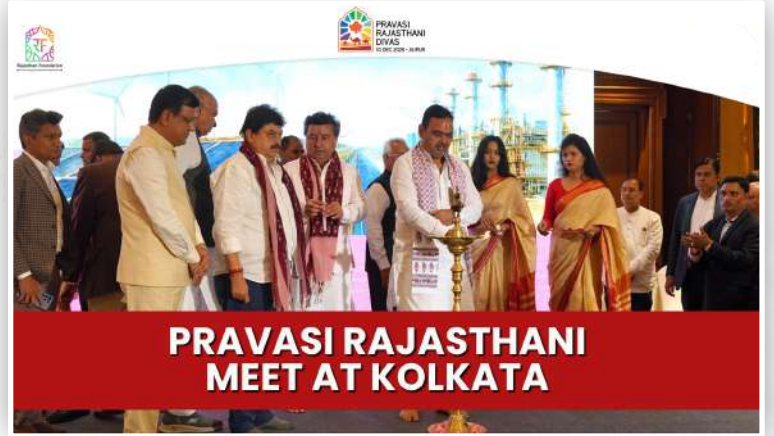
PRAVASI RAJASTHANI MEET AT KOLKATA

अपनी साफ और ईमानदारी छवि से देश और दुनिया में बसे राजस्थानियों को खूब कर रहे हैं प्रभावित, प्रदेश में निवेश के लिए आतुर है प्रवासी राजस्थानी