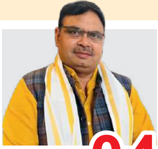
प्रवासी राजस्थानियों से दिल के तार .....