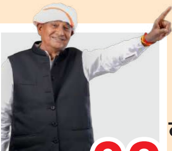
दौसा में विधायक की तरह सक्रिय .....