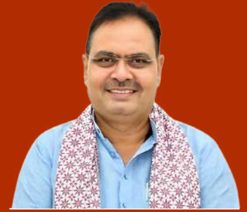
श्री भजनलाल शर्मा माननीय मुख्यमंत्री

स्वदेशी अपनाएं आत्मनिर्भर राजस्थान बनाएं