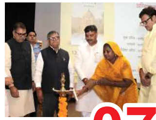
डॉ. सतीश पूनियां की पुस्तक .....

प्रवासी राजस्थानियों से दिल के तार जोड़ रहे भजनलाल शर्मा