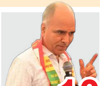
पिछली सरकार में बदनाम हुए विभाग...

डॉ. सतीश पूनियां की पुस्तक 'अग्निपथ नहीं जनपथ' का विमोचन